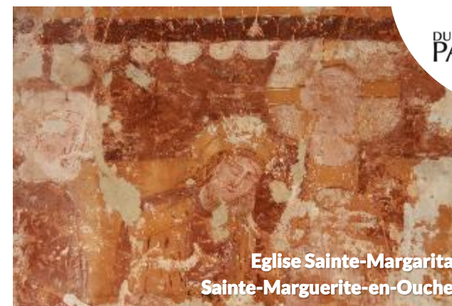
Eglise Sainte-Margarita Sainte-Marguerite-en-Ouche